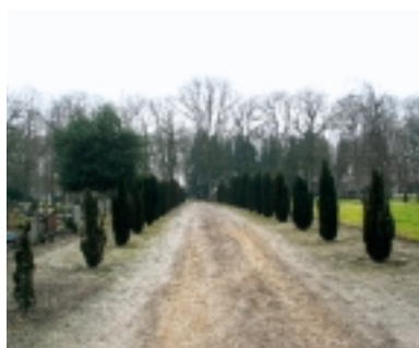
Op de oude begraafplaats van de penitentiaire inrichting Veenhuizen heeft men de taxussen op de hoofdlaan vervangen. Te zijner tijd zal het beeld weer compleet zijn